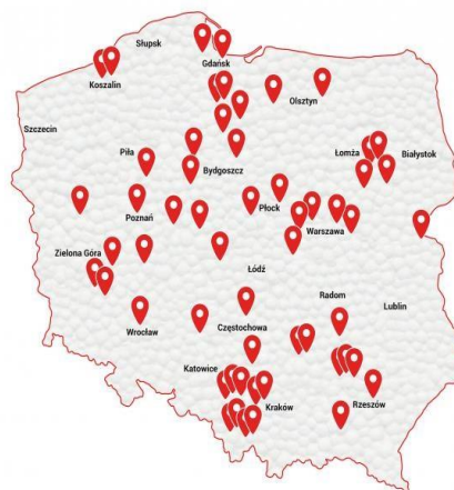
Rysunek 1. Firmy produkujące płyty styropianowe

Niniejsza deklaracja EPD odnosi się do płyt z polistyrenu ekspandowanego (EPS) wykorzystywanych w budownictwie. Produkty stosowane są głównie do izolacji termicznej i akustycznej budynków. Wymiary wyrobów mogą się różnić w zależności od producenta i potrzeb rynku oraz konkretnego zastosowania. Uśredniona gęstość EPS wyznaczona na potrzeby EPD, na podstawie danych dostarczonych przez Producentów, wynosi 15 kg/m 3 . Niniejsza EPD ma